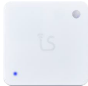
LS Hub E