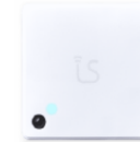
LS Mini Next